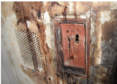
Slika 4: Poškodbe dimnovodnih naprav

Lastnik oz. uporabnik je dolžan omogočiti in zagotoviti redno letno neodvisno meritev emisije dimnih plinov, da se preveri vplive kurilne naprave na okolje, učinkovito rabo energije, tlačne razmere in prisotnost nevarnih koncentracij CO v dimnih plinih.