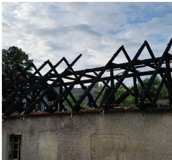
Slika 3: Posledice dimniškega požara – prenos požara na stavbo