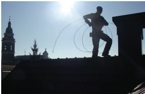
Slika 5: Vaš dimnikar