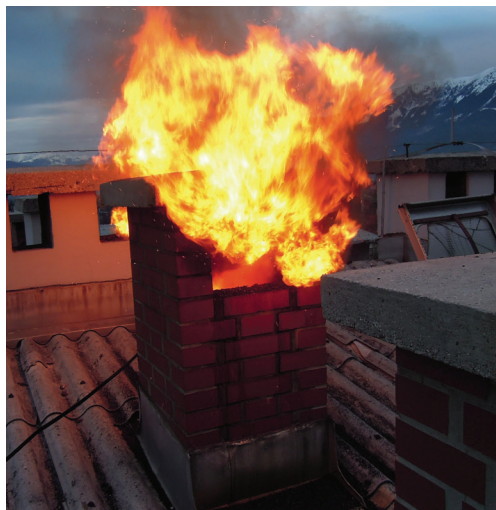
Slika 2: Dimniški požar v razviti fazi – pomembnost lokacije ustja dimovodne naprave